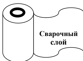
Рисунок 1 - Рулон пленки Амистайл

Плѐнки АМИСТАЙЛ ВР-Т/СР-Т имеют термосвариваемый слой из полиэтилена (PE), расположенный на внутренней стороне полотна пленки (рис. 1).